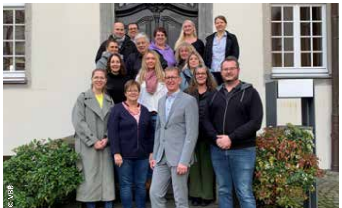
Gruppenfoto der Seminarteilnehmer

Darüber hinaus bot sich abends die Gelegenheit, den mittelalterlichen Weihnachtsmarkt in Siegburg zu besuchen. Abschließend bleibt festzustellen, dass es ein sehr erfolgreiches Seminar war und mit dieser Thematik wieder angeboten werden sollte.