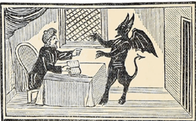
Holzschnitt: Künstler unbekannt