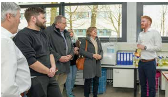
Besuch des WIWeB in Erding

Derzeit wird geprüft, ob man in Erding ein neues Innovationszentrum der Bundeswehr innerhalb des Organisationsbereiches Ausrüstung, Informationstechnik und Nutzung (AIN) einrichten kann. Vorbereitend soll es bald einen Aufbaustab geben. Noch nicht bekannt war vor Ort, ob das InnoLabSysSdt in diesen Strukturen aufgehen soll.