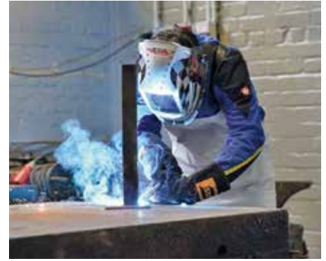
Mitarbeiterinnen und Mitarbeiter des BwDLZ Rotenburg (Wümme) bei der Arbeit